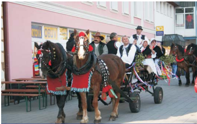
Folklorný súbor Uhrovčan