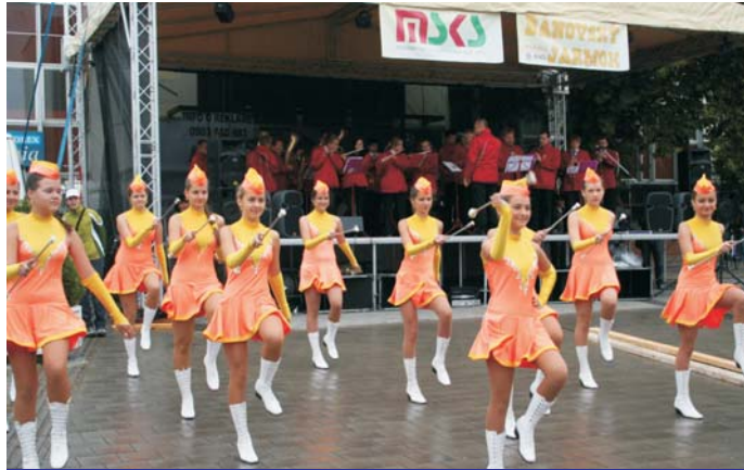
Mažoretkový súbor Hradište zo SZUŠ Akord

Ak odpoviete kladne, tak určite budete súhlasiť, že horšie počasie sme si nemohli vybrať. Meteorológovia vydali varovanie, že v piatok v našej oblasti môže dosahovať vietor rýchlosť až 90 km za hodinu. K tomu predpovedali dážď a výrazné ochladenie. Temer všetko im vyšlo. Snáď len vietor nedosahoval avizované parametre. Ale stačil narobiť riadnu šarapatu. A prečo to všetko spomínam? Len kvôli tomu, aby sme si uvedomili, že počasie je pri organizovaní