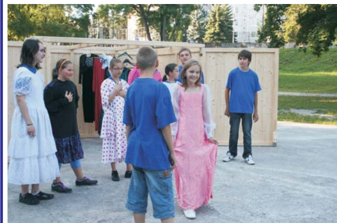
Muzikálové vystúpenie Tri slová v podaní literárno-dramatického odboru žiakov a pedagógov ZUŠ D. Karoša na kultúrnom lete 2011.