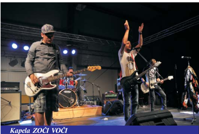
Kapela ZOČI VOČI