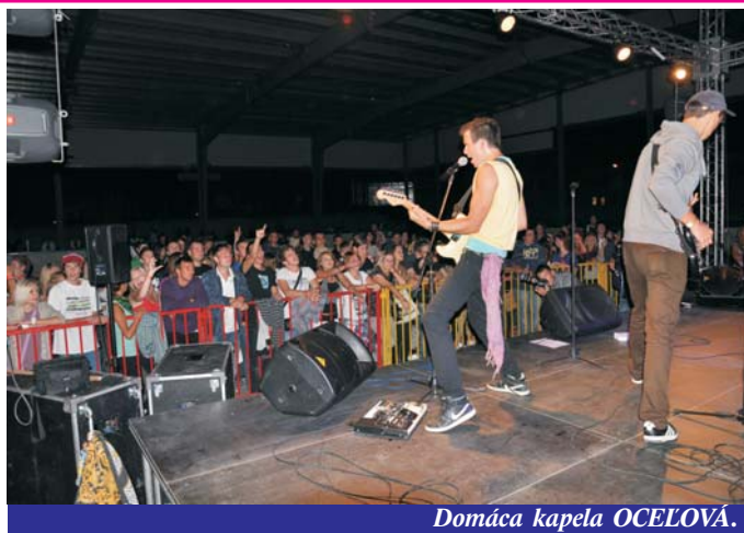
Domáca kapela OCELOVÁ.