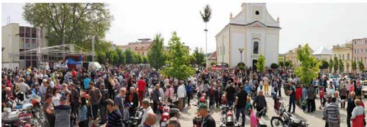
Námestie L. Štúra zaplnili v piatok 8. mája veteráni a ich obdivovatelia...

Informácie s možnosťou prihlásenia sa do Paríža i do Podhájskej môžete získať každý pondelok a streda od 11.00 do 13.00 h v Klube dôchodcov na Farskej ulici alebo na telefóne: 0908 414 414, 0907 493 081.